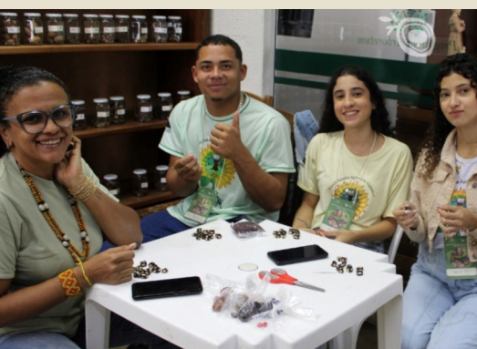
Oficina de Biojóias - artesanato com sementes