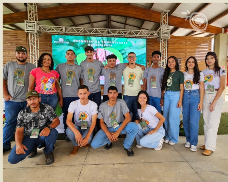
Escola Família Agrícola Vinhático