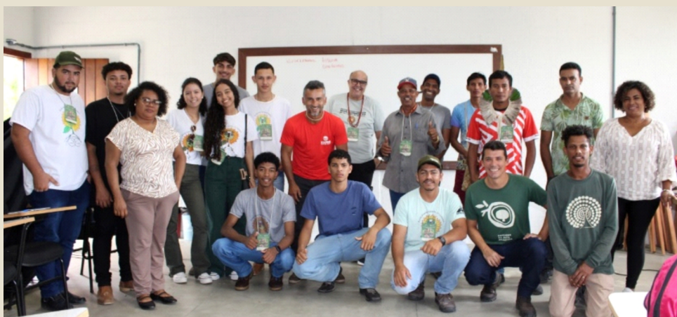
Oficina de Turismo Comunitário