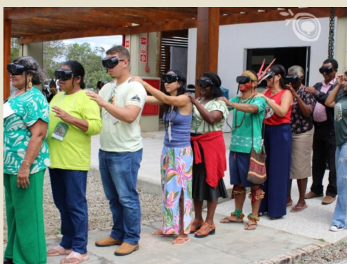
Oficina de educação ambiental e restauração florestal